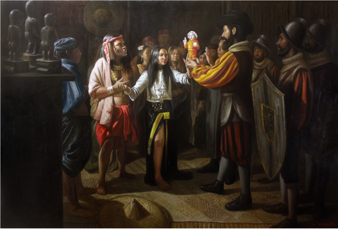
The Gifting of Santo Niño to Queen Juana (2021), by Jun Impas

Suriin ang larawan. Pagkatapos nito ay sagutin ang tanong sa ibaba.