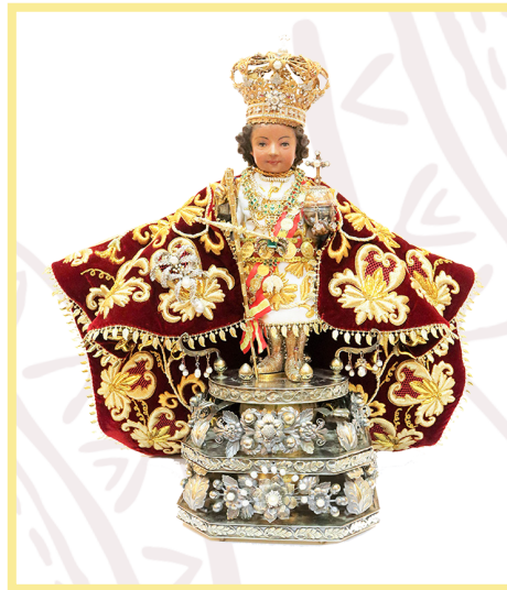
Santo Niño de Cebu. Hinalaw noong Setyembre 15, 2021 sa https://santoninodecebusilica.org/

Panuto: Umisip ng ISANG PANGUNGUSAP na lubos na makapagpapaliwanag sa naging impluwensiya ng debosyon sa Santo Niño ayon sa hinihingi sa ibaba. Isulat ito sa loob ng kahon.